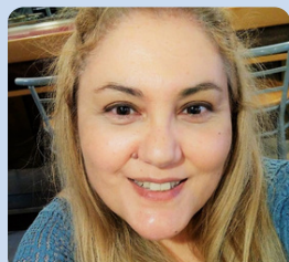
M. Ángeles Urda Comunicación y digital

Con la confianza de Torre Jussana, DINCAT, ECOM, Coordinadora Catalana de Fundaciones, Down Catalunya, Facultad Pere Tarrés -Universidad Ramon Llull-, Asociaciones y Fundaciones Andaluzas (AFA) y Asociación Española de Fundraising (AEFr), entre otros.