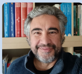
Toni Carulla Web i SEO