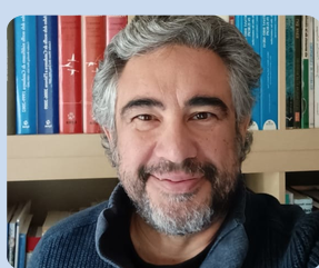
Toni Carulla Web i SEO